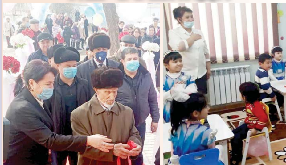
"Жаннатмакон" маҳалласида жойлашган 39-сонли МТТ инвестиция дастурига киритилиб, 3 миллиард сўм пул маблағи эвазига замонавий кўринишда қайта таъмирланди ва барча зарур шароитларга эга, 120 ўринга мўлжалланган мактабгача таълим ташкилоти ўз фаолиятини бошлади.

XONQA AYOTI MUASSIS: Xonqa tuman hokimligi