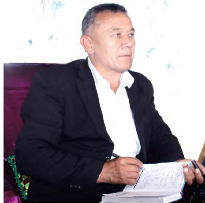
(Давоми. Боши ўтган сонларда)