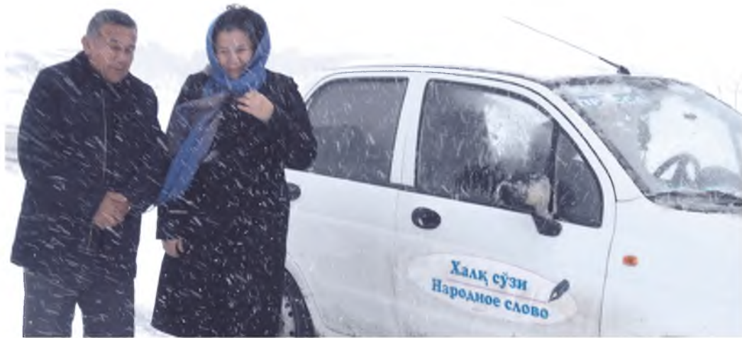
одамлардан бири бўласан.