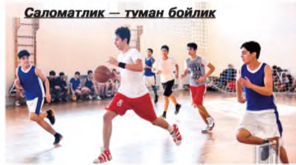
Саломатлик — туман бойлик

нинг жисмоний ривожланиши рақамлаштирилган дастур ёрдамида мониторинг қилиш тизими ишлаб чиқилади.