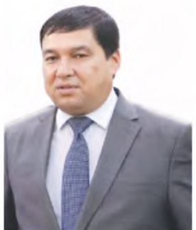
Ўткир ЧОРИЕВ, Бандихон тумани ҳокими